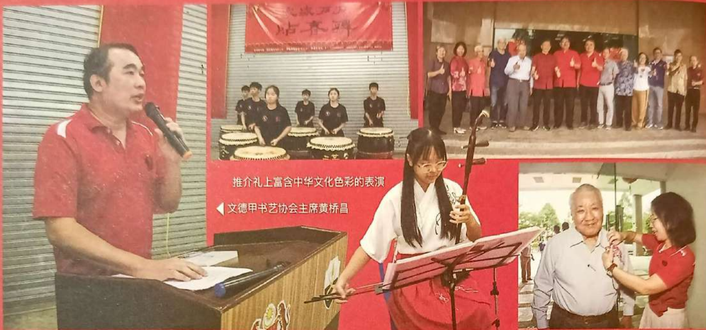
推介礼上富含中华文化色彩的表演