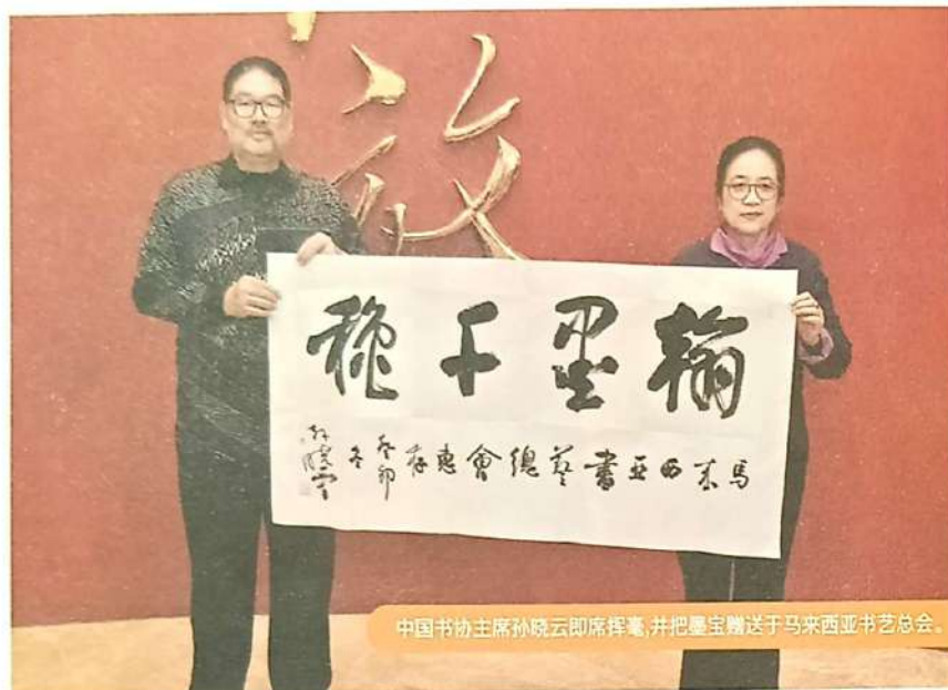
中国书协主席孙晓云即席挥毫,并把墨宝赠送于马来西亚书艺总会。