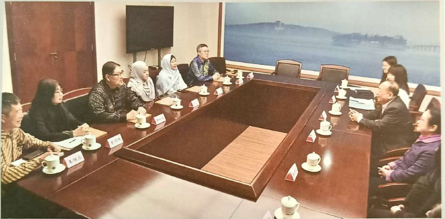
马来西亚书艺总会的一众理事与代表团受邀与中国书法家协会理事们举行会议