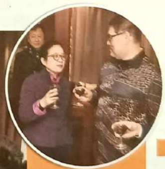
中国书法家协会给予我会高规格的盛情款待，并于席间进行书艺上的交流，双方言谈甚欢