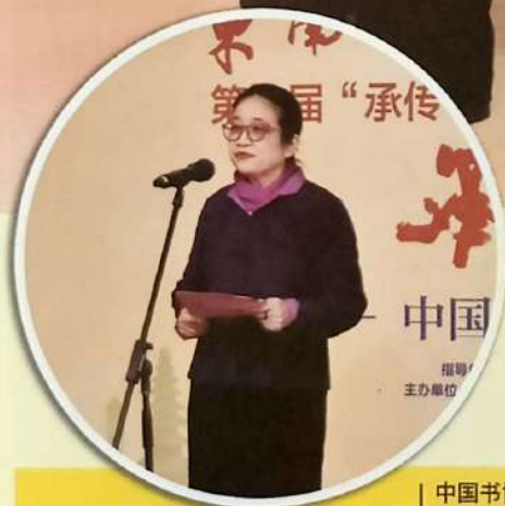
中国书协主席 孙晓云 致词